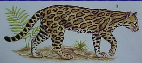
Leopardus pardalis (Ocelote)