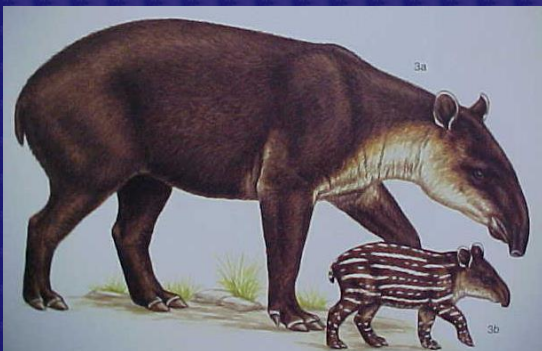
Tapirus bairdii (Tapir, danta)