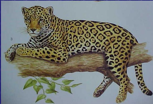
Pantera onca (Jaguar)