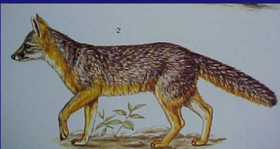
Urocyon cinereoargenteus (Zorra gris, gato de monte)