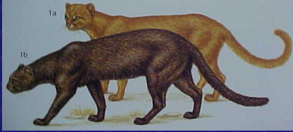
Herpailurus yaguarondi (Onza, jaguarundi)