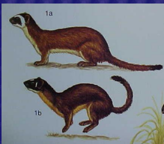
Mustela frenata (Comadreja)