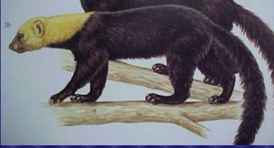
Eira barbara (Perico ligero)