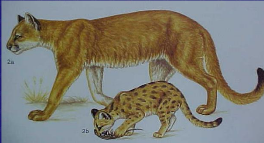
Puma concolor (Puma, león americano, león de montaña)