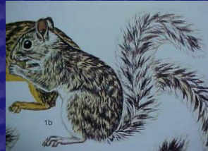
Sciurus variegatoides (Ardilla)