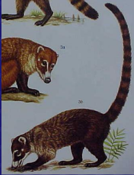
Nasua narica (Pizote, coati)