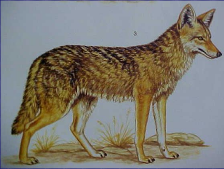
Canis latrans (Coyote)