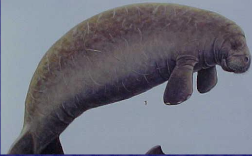
Trichechus manatus (Manatí)