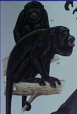
Alouatta pigra (Aullador, zaraguate)