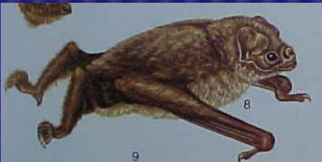
Diphylla ecaudata (vampiro alas blancas)