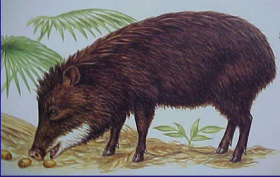
Tayassu pecari (Jabalí, pecarí de labios blancos)