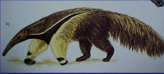
Myrmecophaga tridactyla (Oso caballo)