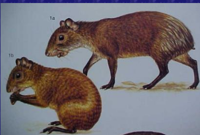
Dasyprocta punctata (Cotuza, guatuza)