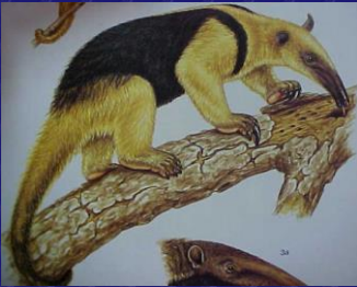
Tamandua tetradactyla (Hormiguero)