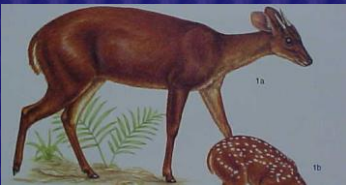
Mazama americana (Cabrito, huitzizil)