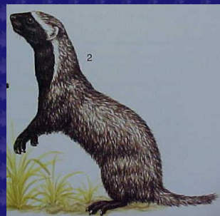
Galictis vittata (Grisón)