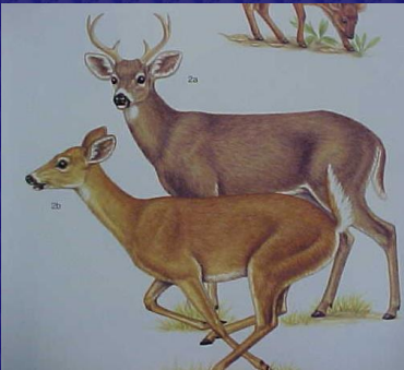
Odocoileus virginianus (Venado cola blanca)