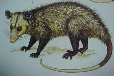
Didelphis marsupialis , Tacuasín, Tlacuache, Zorro pelón