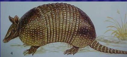
Dasypus novemcinctus (Armadillo de nueve bandas, cuzo, cuzuco)