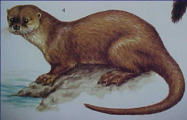
Lontra longicaudis (Nutria, perro de agua)