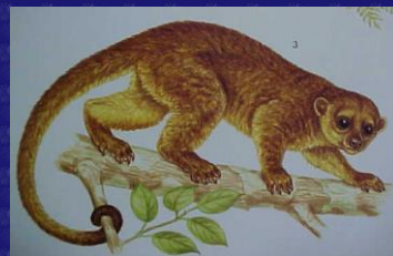
Potos flavus (Micoleón)