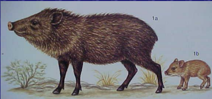
Tayassu tajacu (Coche de monte, pecarí de collar, zaíno)