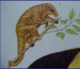
Cyclopes didactylus (Flor de balsa)