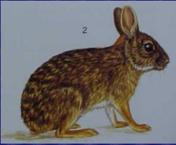
Sylvilagus brasiliensis (Conejo silvestre)