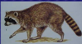
Procyon lotor (Mapache, mapachín, osito lavador)