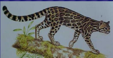
Leopardus wiedii (Tigrillo, margay)