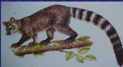
Bassariscus sumichrasti (Cacomistle, kinkajou)