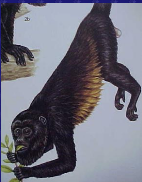
Alouatta palliata (Aullador, zaraguate)