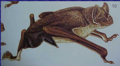
Desmodus rotundus (vampiro común)