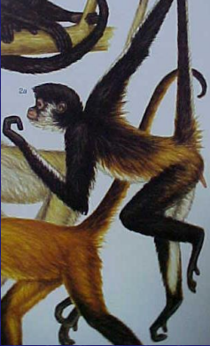
Ateles geoffroyi (Mono araña)