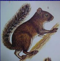
Sciurus deppei (Ardilla)