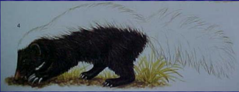
Conepatus mesoleucus (Zorrillo)