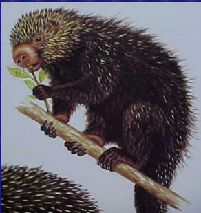
Coendu mexicanus (Puercoespín)